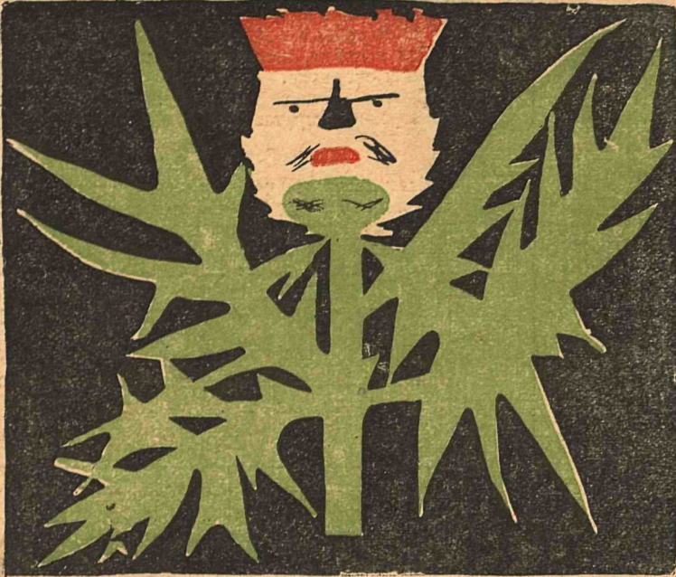
1. ЧЕРТОПОЛОХ— кулак в предсельсоветах.

2090 ЦЕНТРАЛЬНЫЙ 20 МАР 1995 НАУЧНАЯ ПЕДАГОГИКА