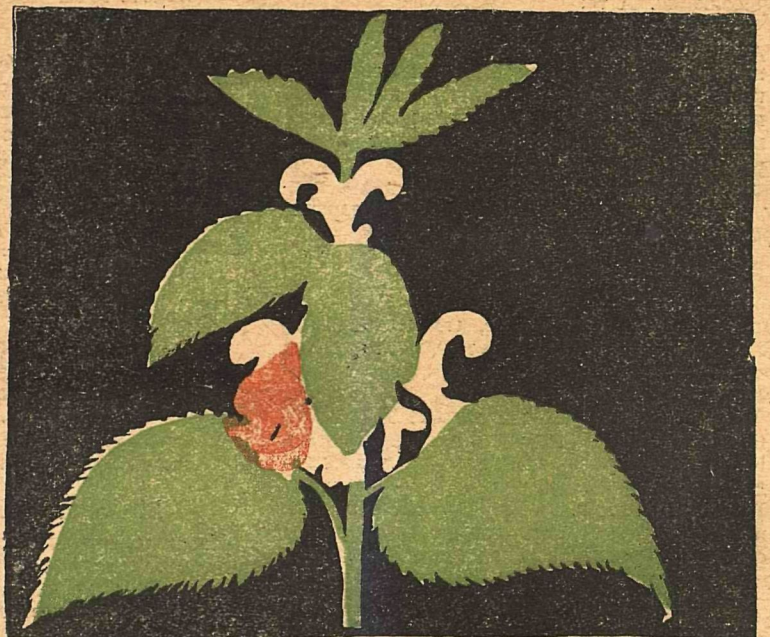
4. КРАПИВА— аблакат подпольный, ябеда.