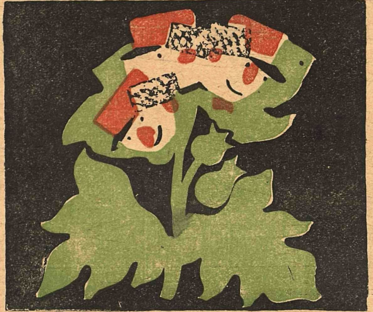
2. БЕЛЕНА— пьяная милиция.