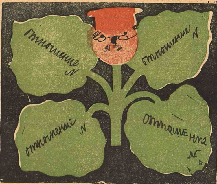
3. РЕПЕЙНИК— волостной бюрократ.