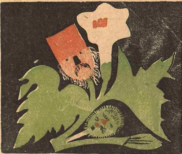
5. ДУРМАН— поп с самогонщиком.